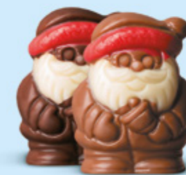
Duo praliné et caramel ou praliné et éclats de noisettes caramélisées