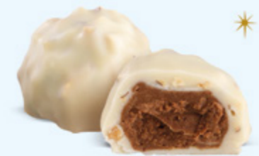
Praliné aux amandes et éclats d'amandes, chocolat blanc