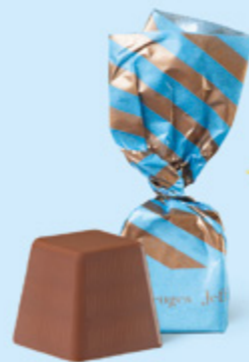
CHOCOLAT AU LAIT Praliné et sucre pétillant