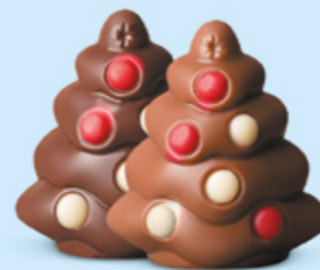
Praliné et sucre pétillant ou praliné et éclats de nougat

Nos choco'pralinés font partie de la magie de Noël. Ils plaisent aux petits... comme aux grands !