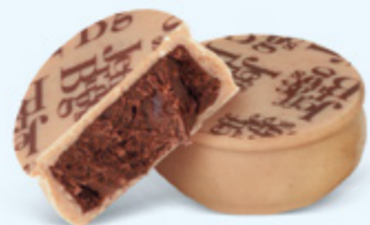
Ganache aromatique de chocolat noir au cacao d'Équateur, chocolat blanc caramélisé