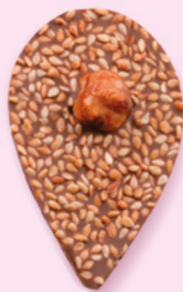
GRAINE DE JULIETTE Chocolat au lait 35% de cacao, sésame, noisette caramélisée