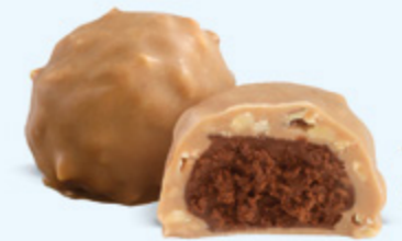
Praliné aux noisettes et éclats d'amandes, chocolat blanc caramélisé