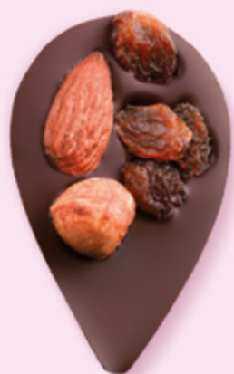
JULIETTE IN THE CITY Chocolat noir 60% de cacao, amande, noisette, raisins secs