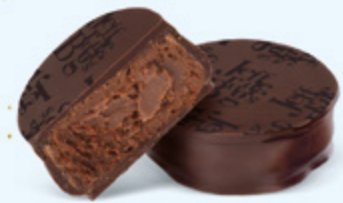
Ganache corsée de chocolat noir au cacao du Venezuela, chocolat noir 70% de cacao

Venezuela, Saint-Domingue, Équateur, Sao Tomé... Une invitation au voyage vers les plus fameuses origines de cacao.