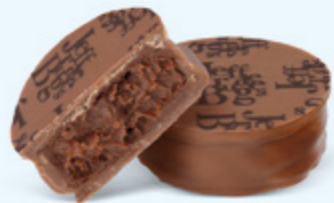
Ganache de chocolat noir au cacao fruité de Saint-Domingue, chocolat au lait 36% de cacao