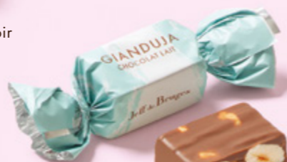
Gianduja chocolat au lait