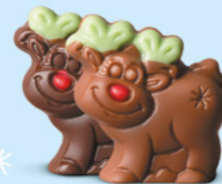
Praliné et éclats de noisettes torrifiées ou praliné et éclats de crêpe dentelle