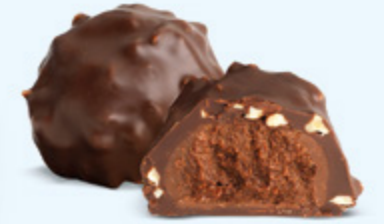
Praliné aux noisettes et éclats d'amandes, chocolat noir 60% de cacao