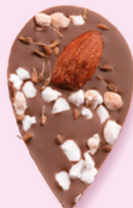
LE SONGE DE JULIETTE Chocolat au lait 35% de cacao, amande, éclats de nougat, brins d'anis