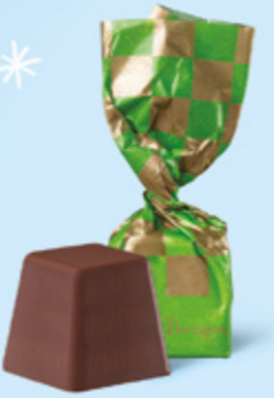
CHOCOLAT NOIR Praliné façon rocher aux éclats de noisettes