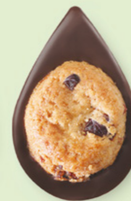
BISCUIT CRANBERRIES Chocolat noir 60% de cacao