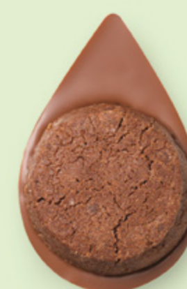
BISCUIT BROWNIE Chocolat au lait 35% de cacao

Les prix barrés sont les prix de vente TTC maximum en boutique. *Prix de vente TTC maximum.