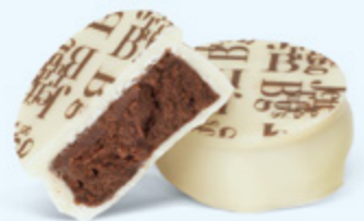
Puissante ganache de chocolat noir au cacao de Sao Tomé, chocolat blanc