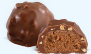
Praliné aux noisettes et éclats d'amandes, chocolat au lait 36% de cacao