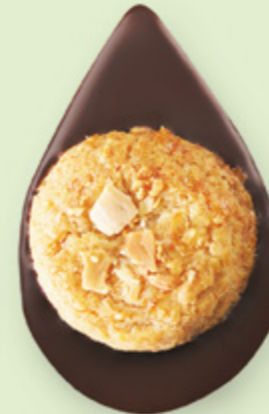
BISCUIT AMANDES Chocolat noir 60% de cacao