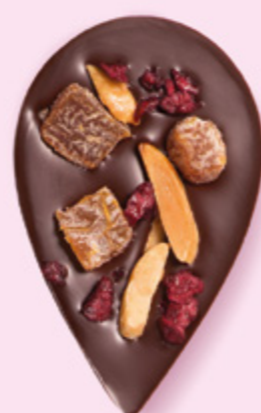
JULIETTE & TOM Chocolat noir 60% de cacao, dés d'abricots secs, amandes caramélisées et morceaux de cerise