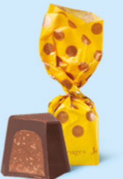
CHOCOLAT NOIR Praliné avec éclats de crêpe dentelle

BOITE DE 245 G NET 19 SUJETS ASSORTIS AU PRALINÉ 7 RECETTES