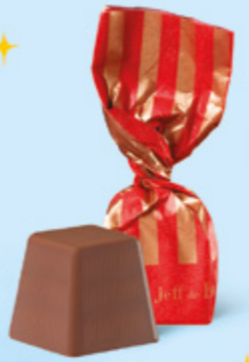
CHOCOLAT AU LAIT Praliné noisettes façon pâte à tartiner