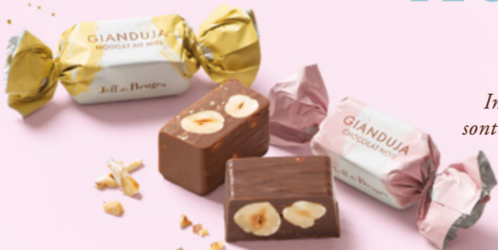
Gianduja chocolat noir