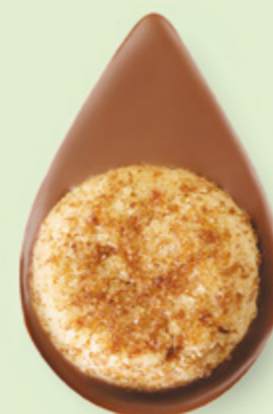
BISCUIT NOISETTES Chocolat au lait 35% de cacao

Un biscuit sablé artisanal posé sur un très bon chocolat ! C'est simple et c'est divin.